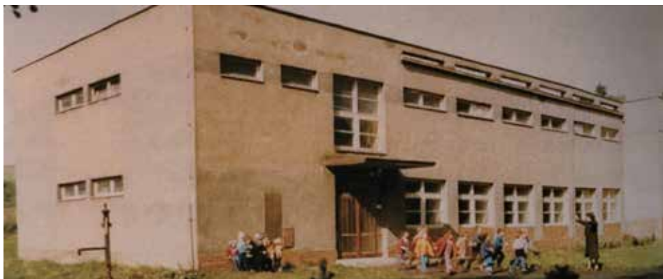
Tak vypadal kulturní dům na počátku 80. let.