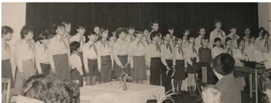
Kulturní dům býval dějištěm oslav všeho druhu.