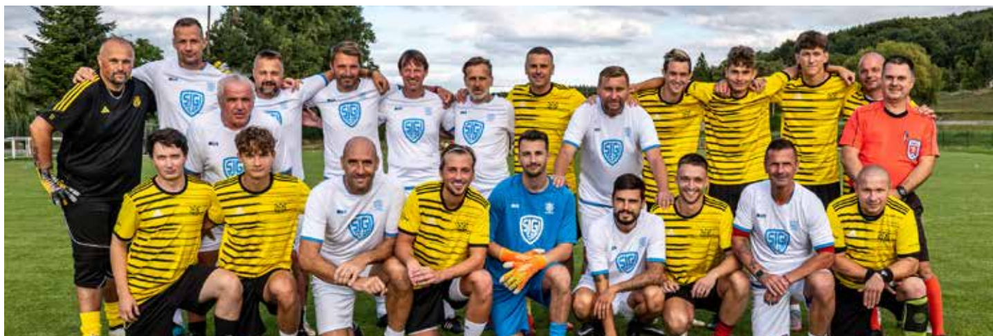
14. září odehrál tým TJ Sokol Tuchoměřice přátelské utkání s týmem internacionálů - legendárních hráčů českého fotbalu.