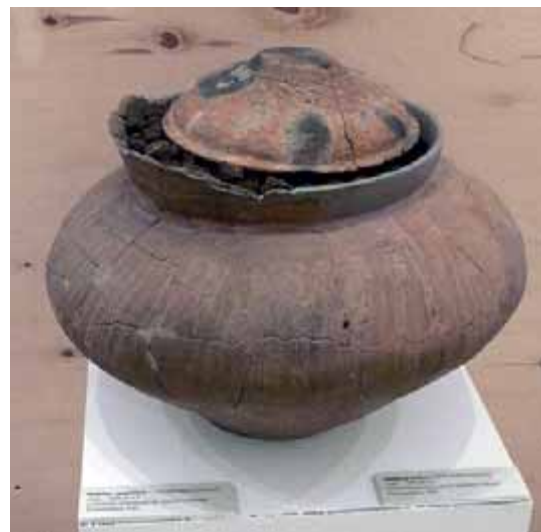
Rekonstruovaná pohřební nádoba z obj. 13

Rozsáhlé sídliště z mladší a pozdní doby bronzové jsme si již představili. Kde jsou však pochováni zdejší obyvatelé? V prvním dílu jsem zmínil stavbu pana Výtoně s domnělým hrobem, ze kterého se vyklubala „pouhá“ zajímavá sídlištní situace. Pozůstatky pohřebiště měly být prozkoumány cca 200 až 300 metrů východněji odtud před rokem 1967. Udané místo odpovídá současnému rodinnému domu v ulici Za Kostelem, takže se vší pravděpodobností se znovu jednalo o sídlištní objekty s keramickými nádobami.