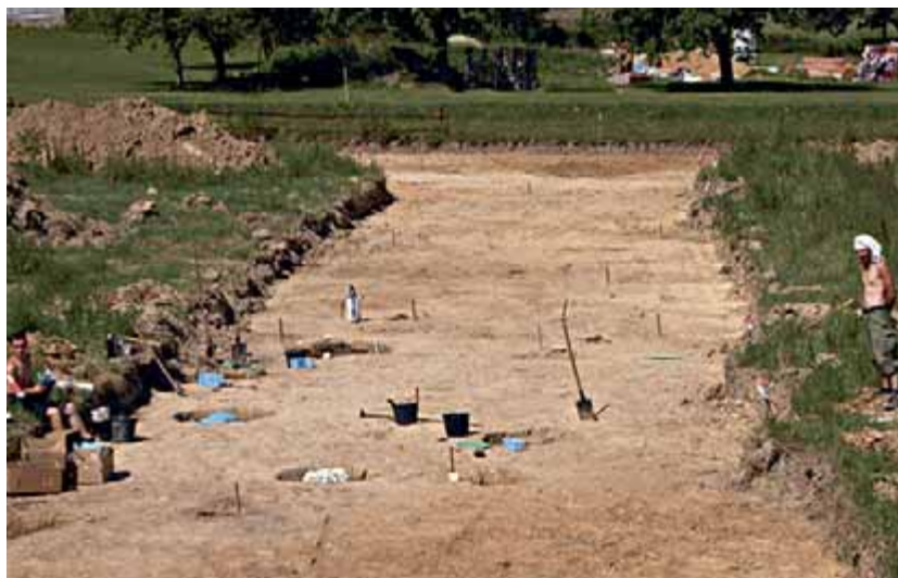
Pohled na plochu výzkumu od východu (L. Šulová)