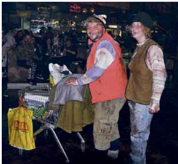
Nejlepší maska letošního karnevalu