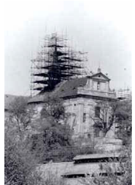
Oprava věže roku 1984