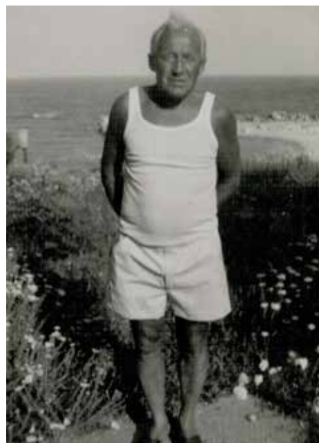
Rok 1986 a dovolená v Rumunsku