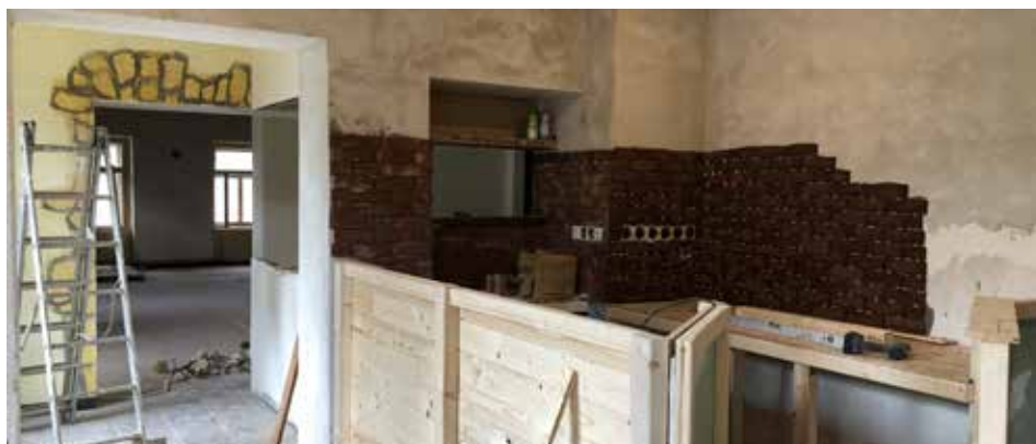
Prostory restaurace procházejí radikální proměnou. „Chceme to tu proměnit na salon, kde se budou lidé potkávat. Otevřeno bude každý den,“ říká Marta Richterová. Postupně čtější noví nájemci zvelebit také okolí restaurace, kde by měla vzniknout zahrádka.