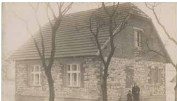
Snímek zachycuje rodný dům Otakara Knížete, jeho tehyní a syna.