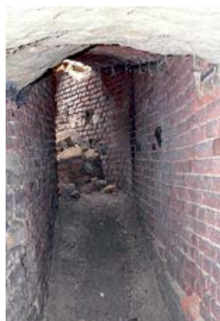
Propad do chodby z roku 2007.

Archeologové provedli odborný průzkum a vše zdokumentovali.