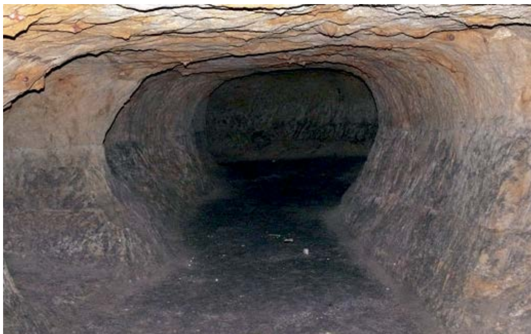
Některé chodby a prostory jsou tesány v písku

Naše výprava do tuchoměřického podzemí pokračuje chodbou, která vede z katolického kostela sv. Víta. Vchod do této chodby je z hrobky za hlavním vchodem do kostela. Samotný vstup do hrobky je pod náhrobními kameny.