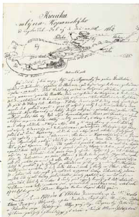
Kopie Kroniky Kopanského mlýna je k nahlédnutí na obecním úřadě