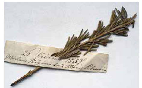
Bezmála 160 let starý prýšec ze Štěpánkovy kroniky.