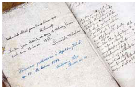
Kronika nalezená na tuchoměřickém zámku