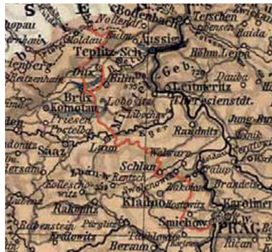
Mapa Pražsko-duchcovské dráhy z roku 1905

Tuchoměřice se nacházely přímo u tzv. Pražsko-duchcovské dráhy, která se začala stavět především kvůli dopravě hnědého uhlí ze severočeské uhelné pánve do hlavního města. Vedla ze smíchovského nádraží Prokopským údolím do dnešní Rudné u Prahy a odtud přes Středokluky a Slaný do Mostu a Duchcova.