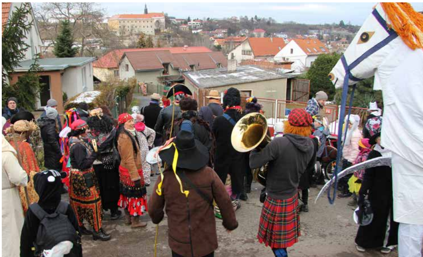
Tuchoměřicemi na konci ledna opět prošel masopustní průvod. Jak se letos vydařil se dočtete na straně 6.