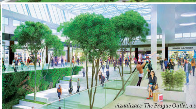
vizualizace: The Prague Outlet, a.s.